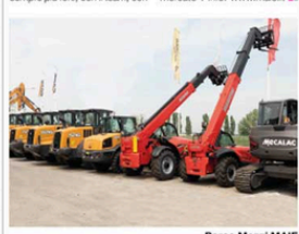
Parco Mezzi MAIE

Elevateur , fondata a Nola (NA) nel 1995, si occupa di noleggio, vendita, assistenza piattaforme aeree, macchine movimento terra, camion elevatori. È concessionaria ufficiale e officina autorizzata di BRAND internazionali come Genie, Hyundai, Merlo, CTE, Palazzani. Come distributore opera in tutto il centro e sud Italia. Come noleggiatore dispone di filiali a Caserta, Salerno e in tutta la Campania, oltre 600 unità. Da 25 anni parte del Gruppo Verpa, storico leader in Italia nel noleggio con 7000 macchine, per il 2026 Elevateur si concentrerà sulle attività nelle regioni del sud e nell'implementazione in flotta di mezzi elettrici e di ultimissima generazione. Info: www.elevateur.it